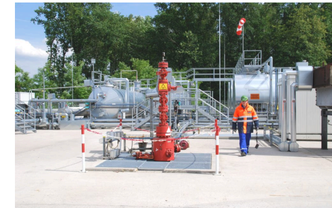
Beispiel: Eruptionskreuz auf der Bohrung Römerberg 1

Nach Ende der Bohrarbeiten wird die Bohrung mit einem so genannten Eruptionskreuz verschlossen.